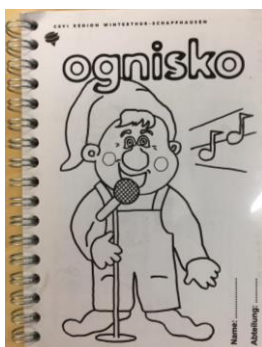
Ognisko klein CHF 6.00