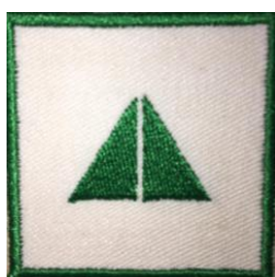
Helfer:innenkurs CHF 4.90