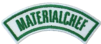
Materialchef CHF 3.70