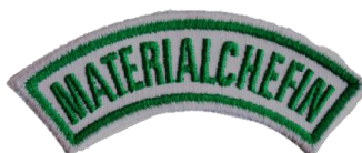
Materialchefin CHF 3.70