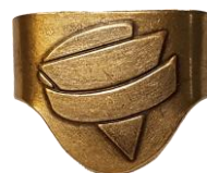
Foulardring CHF 4.90