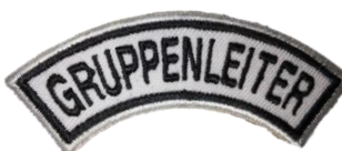
Gruppenleiter CHF 4.90