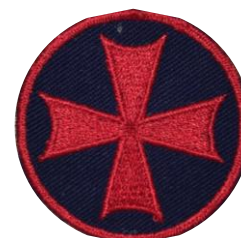
Hugenottenkreuz blau/rot (f.) CHF 2.50