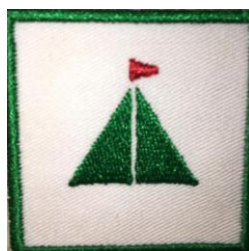
GLK 1 CHF 3.90