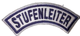
Stufenleiter CHF 4.90