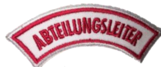
Abteilungsleiter CHF 3.70