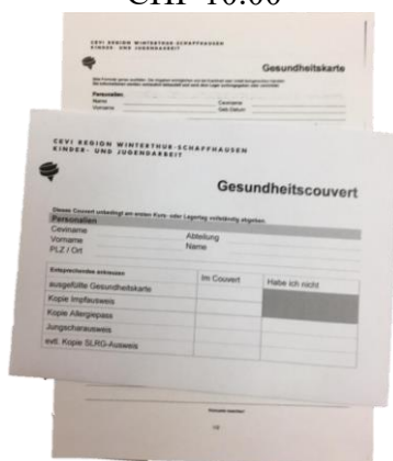
Gesundheitscouvert + Karte CHF 0.30