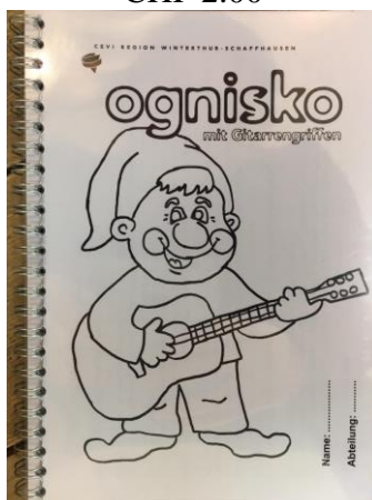
Ognisko gross CHF 10.00