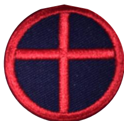
Kreuz im Schild blau/rot (m.) CHF 2.50