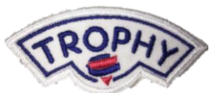
Trophy CHF 4.00