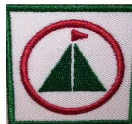
GLK 2 CHF 3.90