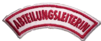
Abteilungsleiterin CHF 3.70