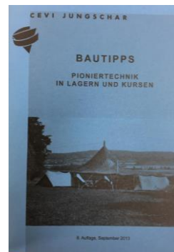
Bautipps CHF 3.00