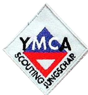
YMCA Scouting CHF 3.90