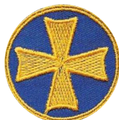
Hugenottenkreuz blau/gelb (f.) CHF 2.50