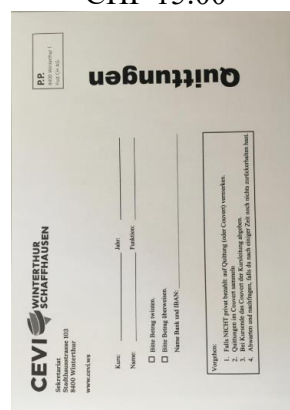
Quittungscouverts CHF 0.30

Cevi Region Winterthur-Schaffhausen – Kinder und Jugendarbeit Sekretariat Stadthausstrasse 103 8400 Winterthur Tel. 052 212 80 12 info@cevi.ws