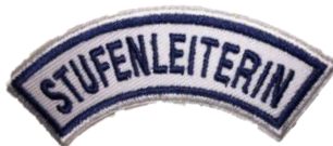
Stufenleiterin CHF 4.90