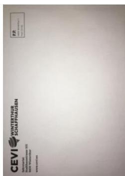
Couverts WS CHF 0.20