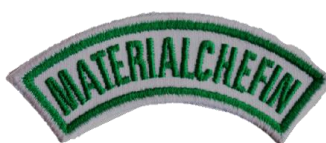
Materialchefin CHF 3.70