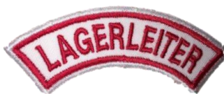
Lagerleiter CHF 3.70