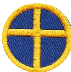
Kreuz im Schild blau/gelb (m.) CHF 2.50