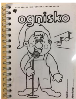
Ognisko klein CHF 6.00