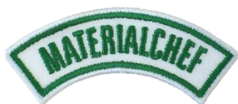
Materialchef CHF 3.70