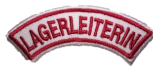
Lagerleiterin CHF 4.90