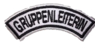
Gruppenleiterin CHF 3.70