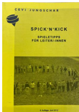
Spick'n'Kick CHF 2.00