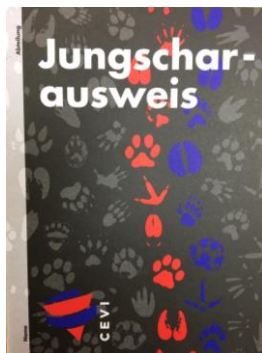
Jungscharausweis CHF 3.00